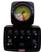
Mando eléctrico 5 vías