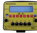
Computadora Cronos 250