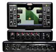
Computadora Bravo 400-S 5/7 vías