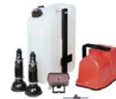
Marcador de espuma