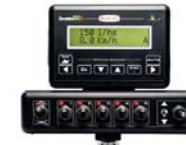
Computadora Bravo 180-S 5/7 vías